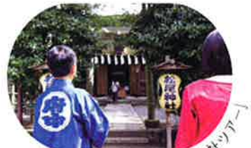
大國魂神社境内を巡る「神社ツアー」